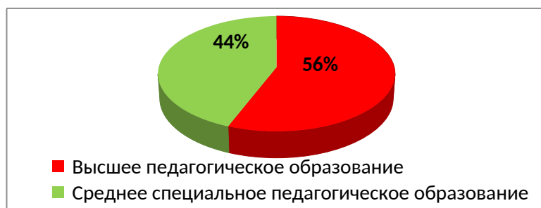
Уровень образования педагогов